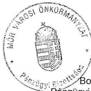
Bogyó Viktor Pénzügyi Bizottság elnöke