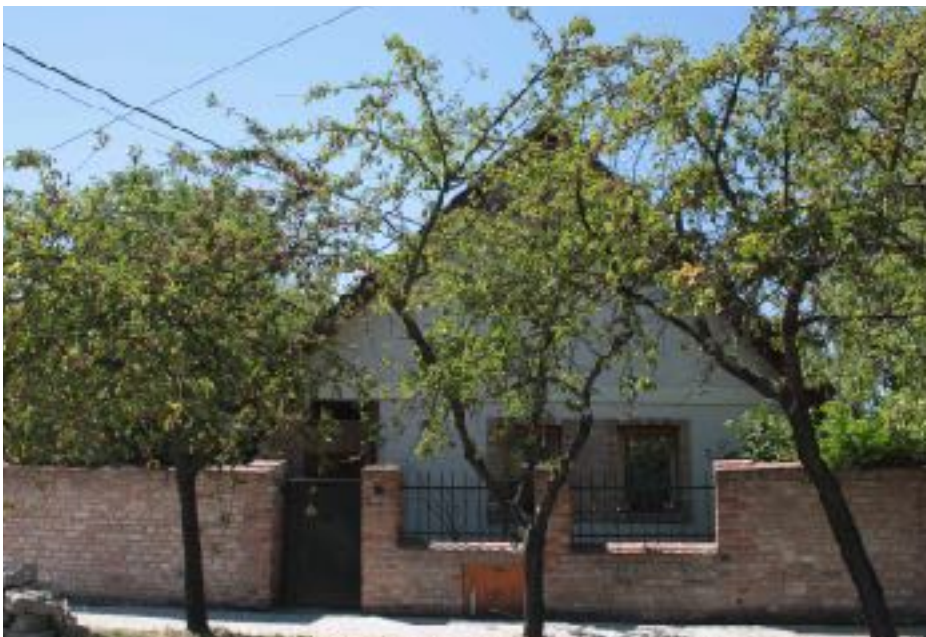
Kossuth Lajos utca polgári lakóházak és parasztházak.