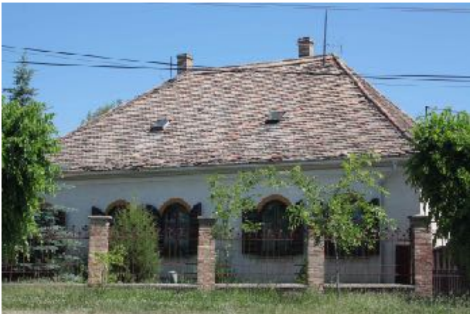
Széchenyi utca belső szakaszán régi gazda házak, nagy kertek.