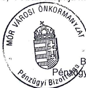
Bogó Viktor Pénzügyi Bizottság elnöke