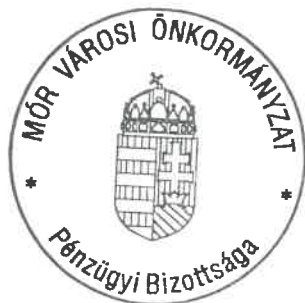
Bogyó Viktor Pénzügyi Bizottság elnöke