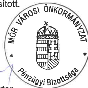
Bogó Viktor Pénzügyi Bizottság elnöke