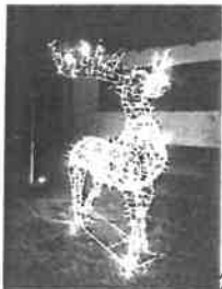
Szarvas 220 cm hosszú, 160 cm magas (agancsnál)