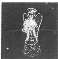
Angyal 175 cm magas, 120 cm széles,