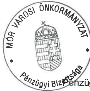
Bogyó Viktor Pénzügyi Bizottság elnöke