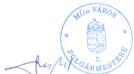
Fenyves Péter polgármester