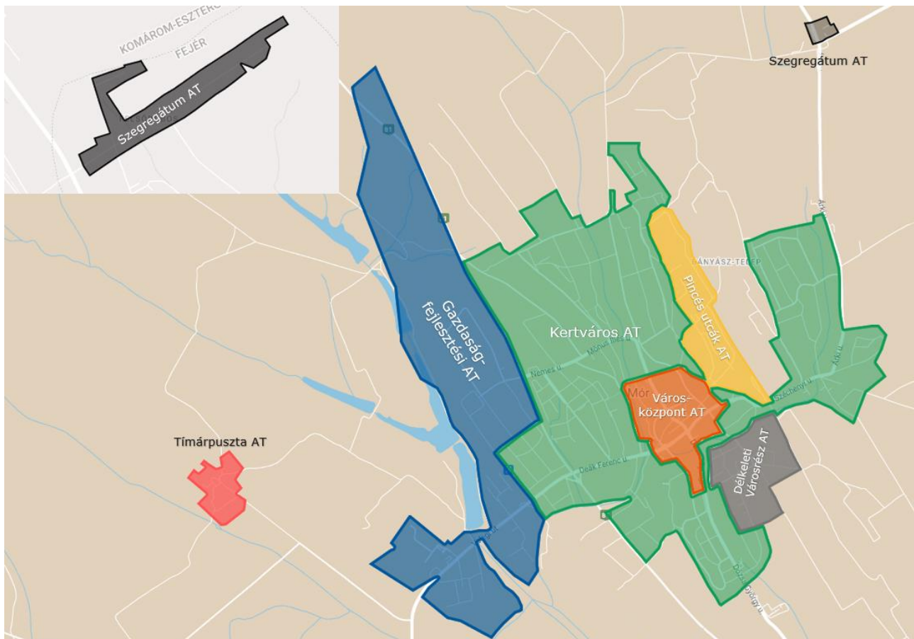
2. ábra - Mór akcióterületi városrészei

A városrészek alatt a jelen stratégia 5.2 Az akcióterületek kijelölése, a kijelölés és a lehatárolás indoklása című fejezetében meghatározott akcióterületeket értjük. Az akcióterületeket az alábbi térképen mutatjuk be előzetesen: