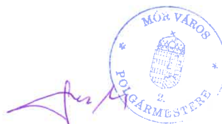
Fenyves Péter polgármester