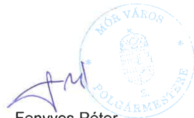
Fenyves Péter polgármester