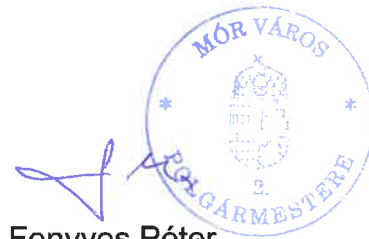
Fenyves Péter polgármester