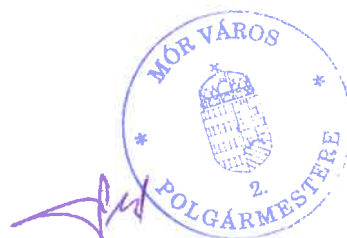
Fenyves Péter polgármester