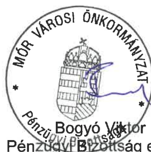
Bogyó Viktor Pénzügyi Bizottság elnöke