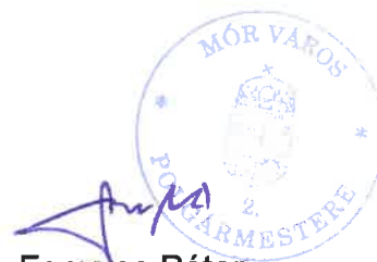
Fenyves Péter polgármester